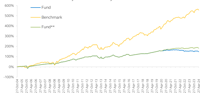
Kinerja Reksa Dana Sejak Diluncurkan

*OB: Obligasi, PU: Pasar Uang, SH: Saham